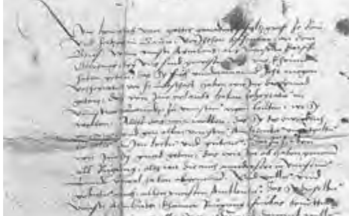
Garchinger Freiheitsbrief von 1331 (Ausschnitt).

stimmen. Innerhalb der herzoglichen Verwaltung war Garching Sitz des „Amt aufm Gfild“, zu dem acht Gemeinden von Fröttmaning bis Neufahrn gehörten.