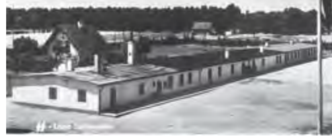
SS-Lager Schleißheim, Postkarte 1938.