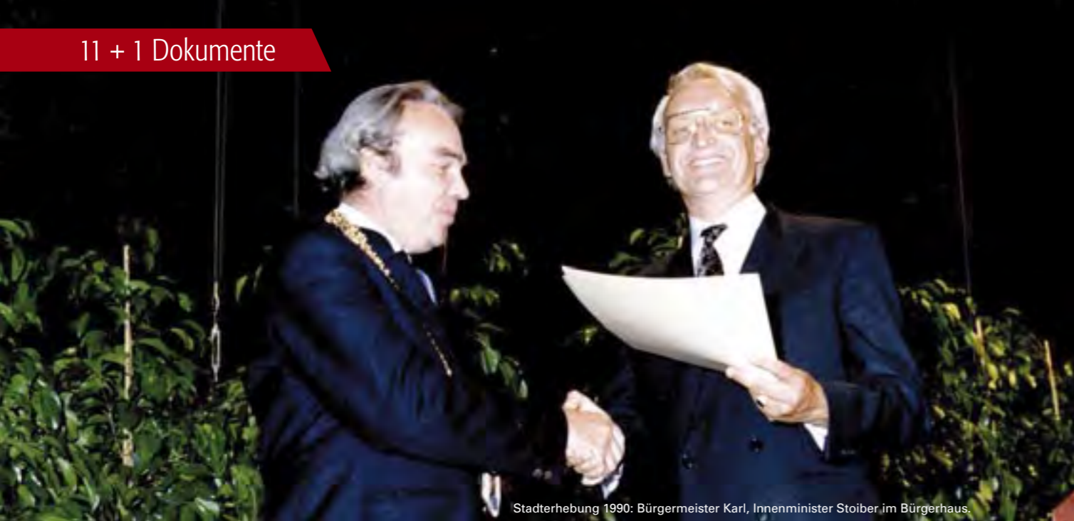
Stadterhebung 1990: Bürgermeister Karl, Innenminister Stoiber im Bürgerhaus.