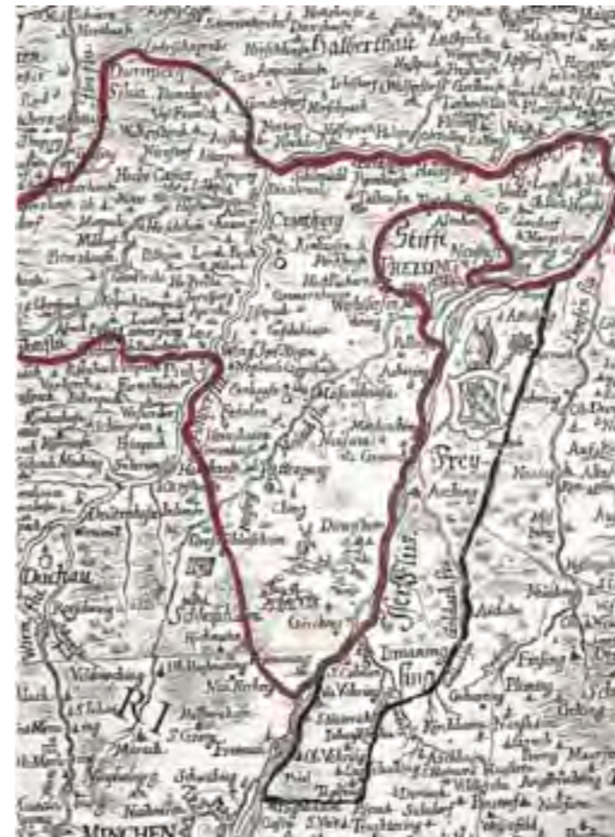
Herzogl. Landgericht Kranzberg und Grafschaft Ismaning des Hochstifts Freising.

anwesen, deren Inhaber namentlich genannt werden. Die Abgaben sind Getreide (Weizen, Roggen, Hafer), Vieh (Lämmer) und Käse, sogar Wein aus der Taverne. Hier wird das Dorf sichtbar, das von der Tegernseer Klosterherrschaft aufgebaut worden war.