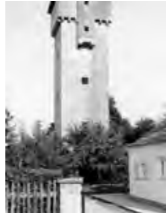
Wasserturm von 1912.