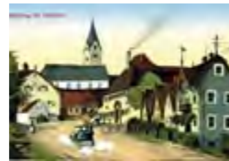
Postgasthof, Postkarte um 1900.

Garching bekommt Anschluss an die große Welt: Am 2. April 1785 erhält der Tafernwirt Franz Xaver Fuhrmann (auch Fürmann geschrieben) die Bestallungsurkunde zur Führung einer kaiserlichen Reichsposthalterei als Mittelstation an der Postroute von München über Freising nach Landshut und Regensburg. 1809