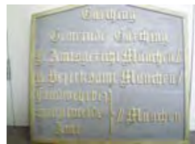
Ortstafel ca. 1862.

Im Jahre 1862 wurden Gericht und Verwaltung getrennt in Amtsgericht und Bezirksamt. Das Bezirksamt München I hatte