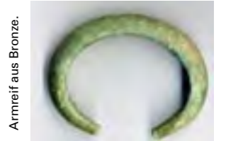
Armreif aus Bronze.

Garching war schon in der Vorzeit ein beliebter Wohnort. Fundsachen gibt es aus der Jungsteinzeit von einem Friedhof am heutigen Echinger Weg, aus der Bronzezeit von Hügelgräbern beim heutigen Lidl-Markt, von einem Keltendorf nordöstlich des